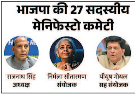
राजनाथ सिंह अध्यक्ष, निर्मला सीतारमण संयोजक, पीयूष गोयल सह संयोजक

नई दिल्ली। भाजपा ने शनिवार को लोकसभा चुनाव 2024 के लिए मेनिफेस्टो कमेटी का ऐलान किया। कमेटी में कुल 27 मंभर हैं। रक्षा मंत्री राजनाथ सिंह को कमेटी का अध्यक्ष बनाया गया है। वहीं वित्त मंत्री निर्मला सीतारमण संयोजक होंगी, पीयूष गोयल सह संयोजक बनाए गए हैं।