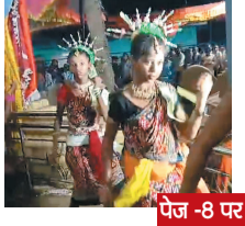
पेज - 8 पर

वर्ष: -16 अंक: 146 डाक पंजीयन 030/रायगढ़/2015-2017 मूल्य: 3 ₹ पृष्ठ: 8