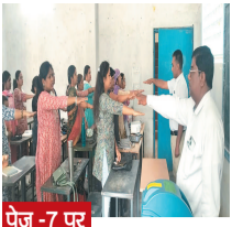
पेज - 7 पर