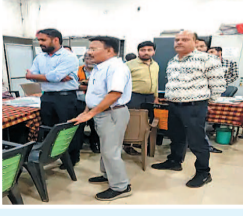
जमा होने हैं, वे सभी आज खुले हुए हैं। रविवार को भी लोगों की सुविधा के लिए ऑफिस खुले रहेंगे। वहीं जमीन की रजिस्ट्री का काम भी लगातार जारी है। शुक्रवार को गुड फ्राइडे की छुट्टी होने के बावजूद रजिस्ट्री दफ्तर