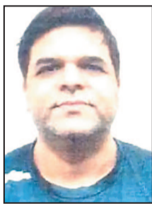
जांच के दौरान ED को छत्तीसगढ़ के अफसरों और

रायपुर। महादेव सट्टा ऐप मामले में ED (प्रवर्तन निदेशालय) ने दुबई के हवाला ऑपरेटर की 580 करोड़ की संपत्ति जब्त की है। इसमें 3.64 करोड़ कैश और कीमती सामान शामिल है।