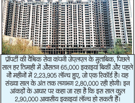
प्रॉपर्टी की वैश्विक सेवा कंपनी जेएलएल के मुताबिक, पिछले साल हर तिमाही में औसतन 65,000 इकाइयाँ बिक्री और पहले नौ महीनों में 2,23,905 लॉन्च हुए, जो एक रिकॉर्ड है। यह संख्या साल के अंत तक लगभग 2,80,000 रही होगी। इन आंकड़ों के आधार पर कहा जा रहा है कि इस साल कुल 2,90,000 आवासीय इकाइयाँ लॉन्च हो सकती हैं।

नौ महीनों में 2,23,905 लॉन्च हुए, जो एक रिकॉर्ड है। यह संख्या साल के अंत तक लगभग 2,80,000 रही होगी। इन आंकड़ों के आधार पर कहा जा रहा है कि इस साल कुल 2,90,000 आवासीय इकाइयाँ लॉन्च हो सकती हैं। जेएलएल का कहना है कि होम लोन ब्याज दरों के ज्यादा होने तथा महंगाई में बढ़ोतरी के बावजूद ग्राहक नई इकाइयों में दिलचस्पी दिखा रहे हैं। यदि रिजर्व बैंक अपनी अगली बैठक में ब्याज दरों में कटौती करेगा, तो उसका असर मकानों तथा व्यावसायिक संपत्ति की खरीद पर भी पड़ेगा। वर्ष 2023 में एक और बात देखने में आई कि ग्राहक बन रहे मकानों में भी निवेश कर रहे हैं। यह एक अच्छा ट्रेंड है, जो बताता है कि आने वाले समय में मकानों की बिक्री लगातार बढ़ेगी। इसके अलावा, महंगे और लज्जरी