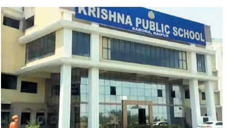
होने के बाद भी बच्चों से लाखों रुपए फीस लिए जाने और आरटीई नियमों के उल्लंघन का भी आरोप लगाया गया है। इन सभी बिंदुओं पर सूक्ष्म जांच करने कहा गया है। रायपुर जिला शिक्षा अधिकारी को जांच पूर्ण कर 12 मार्च तक रिपोर्ट सौंपने कहा गया है। गौरतलब है कि कृष्णा पब्लिक स्कूल के

रायपुर। छत्तीसगढ़ के सबसे बड़े स्कूल समूह कृष्णा पब्लिक स्कूल भिलाई द्वारा राजधानी रायपुर सहित बिलासपुर और अन्य जिलों में सीबीएसई से संबद्धता वाले स्कूलों की दोबारा जांच होगी। संभागीय संयुक्त संचालक द्वारा इस संदर्भ में आदेश जारी कर दिया गया है।