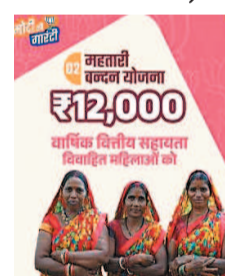
इस योजना के अंतर्गत 21 वर्ष और उससे ऊपर की आयु की पात्र विवाहित महिलाओं को लाभांशित किया जाएगा। प्रदेश की समस्त पात्र विवाहित, विधवा, परित्यक्ता महिला को इस योजना के अंतर्गत प्रतिमाह एक हजार रुपये दिया जाने का प्रविधान है।

रायपुर। छत्तीसगढ़ में महिला सशक्तिकरण को बढ़ावा देने के लिए राज्य सरकार की ओर से महतारी वंदन योजना लागू की गई है। यह योजना एक मार्च से लागू हो जाएगी।