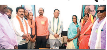
सीएम साय ने की घोषणा