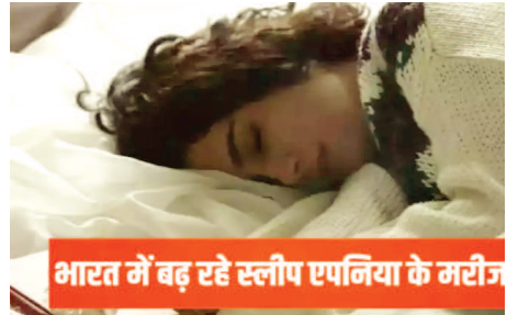
भारत में बढ़ रहे स्लीप एपनिया के मरीज

नई दिल्ली। स्लीप एपनिया यानी सोते वक्त सांस लेने में दिक्कत होना। अंग्रेजी में इसे ऑब्स्ट्रक्टिव स्लीप एपनिया (OSA) कहते हैं। दिल्ली एम्स ने इस बीमारी पर एक नई स्टडी की है। स्टडी करने वालों का दावा है कि भारत में स्लीप एपनिया पीड़ित लोगों की संख्या 10.4 करोड़ तक हो सकती है। शोधकर्ताओं के अनुसार, 11% भारतीय वयस्क OSA से पीड़ित हैं, जिसमें 'पुरुषों' (13%) को महिलाओं की तुलना में (5%) अधिक खतरा है। स्टडी करने वालों ने पिछले दो दशकों में किए गए 7 साल अध्ययनों का विश्लेषण किया जिसके बाद ये नतीजे सामने आए हैं। इस बीमारी पर शोध