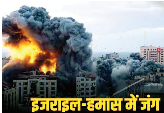
इजराइल-हमास में जंग

इजराइल की सेना के मुताबिक, हमास के चरमपंथियों ने गाजा पट्टी से लगभग 2 हजार से अधिक रॉकेट दागे। जवाब में गाजा पट्टी पर इजरायली हवाई हमलों में गाजा शहर के मध्य में स्थित एक टावर को मिट्टी में मिला दिया। इजराइल की सेना ने कहा कि