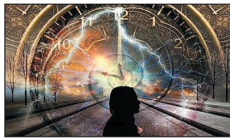
25 हजार प्रकाश वर्ष दूर पृथ्वी की निकटतम गैलेक्सी से प्रकाश को हम तक पहुंचने में 25 हजार वर्ष लगते हैं। यानी, टेलिस्कोप से आज हम 25 हजार वर्ष पुरानी गैलेक्सी देख रहे हैं। अगर वहां कोई मौजूद है, तो क्या उसे पृथ्वी पर महाभारत, रामायण या उससे भी पहले का समय दिख रहा होगा

समय के बारे में हमारी आधुनिक समझ भौतिक विज्ञानी अल्बर्ट आइंस्टीन के सामान्य सापेक्षता के सिद्धांत और कार्य-