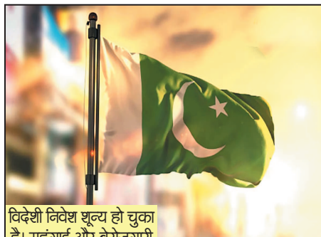
विदेशी निवेश शून्य हो चुका है। महंगाई और बेरोजगारी के कारण पाकिस्तान अपराध की गिरफ्त में आता जा रहा है। बेरोजगारी का आलम यह है कि लाखों युवाओं ने देश छोड़ने के लिए आवेदन कर रखा है, किन्तु पाकिस्तान की सरकार उन्हें मंजूरी नहीं दे रही है।

तिलमिला रहा है। पाकिस्तान की एयरलाइंस के दिवालिया होने की वजह से इंटरनेशनल बेइज्जती हो रही है। कुछ दिन पहले सउदी अरब और यूई में ईंधन के पैसे नहीं चुकाने की वजह से विमानों को रोक लिया गया था। इसके बाद एयरलाइंस अधिकारियों के लिखित आश्वासन के बाद ही विमानों को उड़ान भरने की उम्मीद मिली है। बेरोजगारी का आलम यह है कि फैक्ट्रियां, उत्पाद और व्यवसाय लगभग चौपट हो चुके हैं। विदेशी निवेश शून्य हो चुका है। महंगाई और बेरोजगारी के कारण पाकिस्तान अपराध की गिरफ्त में आता जा रहा है। बेरोजगारी का आलम यह है कि लाखों युवाओं ने देश छोड़ने के लिए आवेदन कर रखा है, किन्तु पाकिस्तान की सरकार उन्हें मंजूरी नहीं दे रही है। फाकाकशी के कारण भिखारियों की संख्या लगातार बढ़ रही है। ऐसी स्थिति