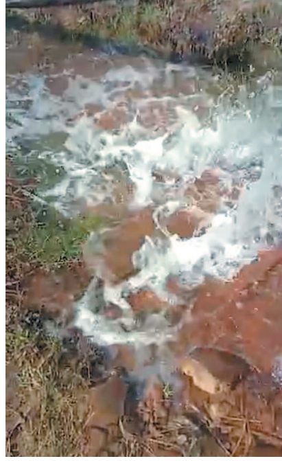
ग्रामीणों को आश्वासन दिया गया था कि ग्रामीण जहा सयंत्र लगा

जा रहा है वही अन्य प्रांत के मजदूर लाकर काम पर रखा जा रहा है कंपनी के प्रबंधक विकास कार्य में योगदान करने के बजाय अनदेखा कर रहा है जिस कारण आसपास के ग्रामीणों में एपीएल अपोलो के खिलाफ खासी नाराजगी देखी जा रही है कंपनी स्थानिय के बाजूद उनके क्षेत्र के लोगों को रोजगार का अवसर नहीं मिल रहे है जबकि स्थानिय लोगों का प्रथम अधिकार होना चाहिए जमीन स्थानिय ग्रामीणों का गया प्रदुषण झेल रहे है और रोजगार बाहरी लोगों को मिल रहा है यहां स्थानिय लोग बेरोजगारी का दर्शन रहे है प्रदुषण से फसल चौपट, पानी का स्तर घटा, और डस्ट के चलते बोर का पानी लाल हो गया है जिससेस्वास्थ्य पर असर डाल रही है स्थानिय लोगों के आवेदन को प्रबंधक के द्वारा दरकिनार कर बाहरी लोगों को काम व टेका दिया जा रहा है सयंत्र के जिम्मेदार प्रबंधन के द्वारा बात करने पर संतोष जनक जवाब नहीं दिया जाता जबकि सयंत्र लगने से पहले इनके द्वारा