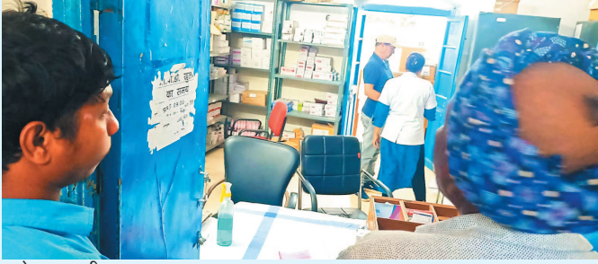
जोहार छत्तीसगढ़- धरमजयगढ़।

धरमजयगढ़ सिविल अस्पताल में मरीजों की संख्या दिन प्रतिदिन बढ़ती जा रही है। जिस तरह से मौसम में भारी उतार चढ़ाव देखने को मिल रहा उससे ओपीडी में मरीज कम होने का नाम नहीं ले रहे। स्थिति यह