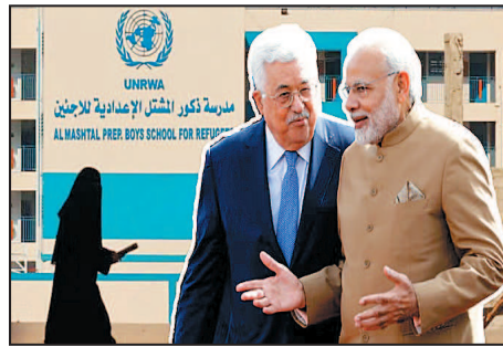
इस्राइल-हमसस युद्ध में कुछ देश इस्राइल के साथ, तो कुछ फलस्तीन के साथ सहानुभूति जता रहे हैं। जरूरी यह है कि इन सहानुभूतियों को शांति बहाली के प्रयासों की ओर मोड़ा जाए, जिसमें अंतरराष्ट्रीय समुदाय के साथ भारत की भी भूमिका है।

प्रभाव पड़ सकता है। पांचवीं बात, नई दिल्ली में आयोजित हुए जी-20 शिखर सम्मेलन में जिस भारत-मध्य पूर्व-यूरोप गलियारे (आइमेक) की स्थापना पर, जिसे चीन की बेल्ट एंड रोड पहल (बीआरआई) का जवाब माना जा रहा है, जो स्वीकृति बनी थी, उस पर भी संकट मंडराने लगे हैं। भारत बेशक यह कह रहा है कि इस युद्ध से आपसी व्यापार में कोई समस्या नहीं आएगी। यूएई और सऊदी अरब हमारे क्रमशः तीसरे और चौथे सबसे बड़े व्यापारिक सहयोगी हैं और इन देशों के साथ भारत के सीधे व्यापार में वाकई कोई भी मुश्किल नहीं है। लेकिन, अगर आइमेक कॉरिडोर की बात करें, तो यह मार्ग सऊदी अरब से जॉर्डन होते हुए इस्राइल जाता है। यह दरअसल रेल और बंदरगाहों को जोड़ने का प्रोजेक्ट है। बंदरगाह तो पहले से जुड़े हुए हैं। प्रधानमंत्री मोदी महागढ़, गुजरात व दूसरी