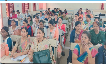
महिला पीठासीन अधिकारियों को दिया गया प्रशिक्षण