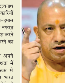
सरकारी प्रवक्ता ने कहा, मुख्यमंत्री ने

उत्तर प्रदेश के मुख्यमंत्री योगी आदित्यनाथ ने गुरुवार को अपने राज्य के अधिकारियों को पश्चिम एशिया में चल रहे इजरायल-हमास युद्ध के बीच फिलिस्तीन के मुद्दे पर नफरत फैलाने और उमदा फैलाने की कोशिश करने वालों के खिलाफ कड़ी कार्रवाई करने का निर्देश दिया।