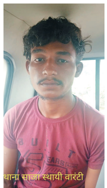
थाना साजा स्थायी वारंटी