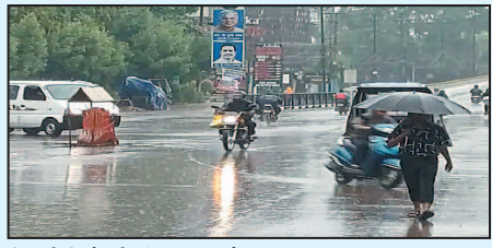
बिजली गिरने की संभावना जताई गई है। रायपुर, दुर्ग, बालोद, राजनांदगांव, सरगुजा, जशपुर, इस जिलों में यलो अलर्ट

रायपुर। छत्तीसगढ़ में मानसून फिर सक्रिय हो गया है। रायपुर में सुबह से बारिश हो रही है। मौसम विभाग में आज कई जिलों में भारी बारिश की चेतावनी जारी की है। गुरुवार को दिन भर हुई बारिश से तापमान में दो से तीन डिग्री तक गिरावट आई है। शुक्रवार को सरगुजा संभाग और बस्तर संभाग में तेज बारिश हो सकती है। इन दोनों संभागों से लगे जिलों में भी अलर्ट जारी किया है। मौसम विभाग ने गौरला-पेंड्रा-मरवाही, बिलासपुर, सुर्गौली, और कबीरधाम जिले में अलर्ट जारी किया गया है। यहां एक दो जगहों पर भारी से अति बारिश और आकाशीय