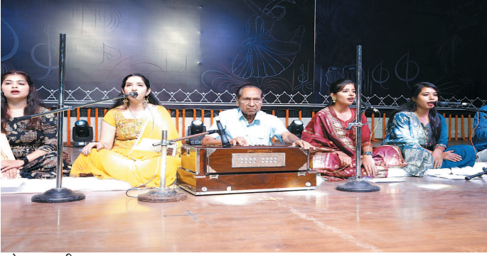
जोहार छत्तीसगढ़- रायगढ़।

मिशन मोड में सफाई कार्य करने निगम आयुक्त को दिए निर्देश