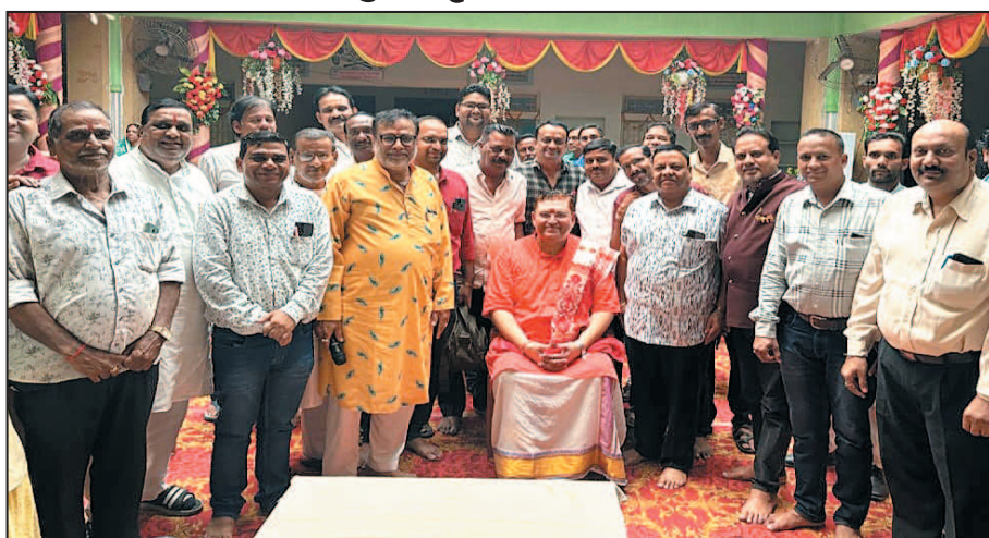
जोहार छत्तीसगढ़- सक्ती।