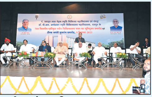
रायपुर। मुख्यमंत्री ने पंडित जवाहरलाल नेहरू चिकित्सा महाविद्यालय के हीरक जयंती समारोह का किया शुभारंभ