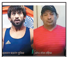
कप्तान बजरंग पूनिया (बाएं) और कोच (दाएं)।

पानीपत। हरियाणा के ओलिंपिक मेडलिस्ट पहलवान बजरंग पूनिया पर आए दिन नई मुश्किलें आ रही हैं। जंतर-मंतर पर पहलवानों के धरना प्रदर्शन के दौरान अपमानजनक टिप्पणी करने के मामले में दिल्ली के पटियाला हाउस कोर्ट ने बजरंग पूनिया को तलब किया है।