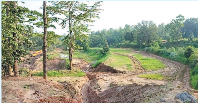
जोहार छत्तीसगढ़- धरमजयगढ़।

कहा वे धमकाते हैं कि तू हमारा क्या कर लेगा