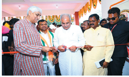
कुल 10 स्वामी आत्मानंद आदर्श महाविद्यालय खोले जा रहे हैं,

रायपुर। मुख्यमंत्री भूपेश बघेल ने सरगुजा संभाग के प्रथम स्वामी आत्मानन्द शासकीय अंग्रेजी माध्यम आदर्श महाविद्यालय का लोकार्पण किया गया। मुख्यमंत्री श्री बघेल ने विधिवत पूजा-अर्चना कर फीता काटकर केशवपुर में महाविद्यालय का लोकार्पण किया। उनके साथ उप-मुख्यमंत्री श्री टीएस सिंहदेव उपस्थित थे।