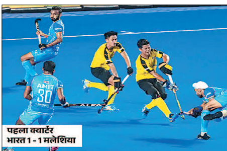
पहला क्वार्टर भारत 1-1 मलेशिया

चेन्नई। भारतीय हॉकी टीम ने एशियन चैंपियंस ट्रॉफी का खिताब जीत लिया है। टीम ने मलेशिया को 4-3 से पराजित कर दिया। भारतीय टीम इस टूर्नामेंट में चौथी बार चैंपियन बनी है। इसी के साथ भारत इस टूर्नामेंट के सबसे ज्यादा खिताब जीतने वाला देश बन गया है। चेन्नई के राधाकृष्णन स्टेडियम में शनिवार को अपना 5वां फाइनल खेल रही टीम इंडिया हाफ टाइम तक 2 गोल से पिछड़ रही थी, तब स्कोर लाइन 3-1 था। फिर मुकाबले के आखिरी दो क्वार्टर में भारतीय खिलाड़ियों ने तीन गोल दागते हुए जीत हासिल की।