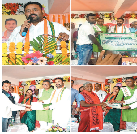
* जिले के 56 हजार से अधिक आदिवासी हितग्राहियों को विभिन्न योजनाओं के तहत 15 करोड़ 24 लाख रुपये से अधिक राशि का किया वितरण