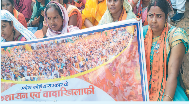
घेराव किया। इस प्रदेशव्यापी आंदोलन में रायगढ़ जिले के

क्षेत्र में आगामी विधानसभा चुनाव की तैयारियों के साथ-साथ राजनीतिक घटनाक्रमों के तेजी से बदलने का सिलसिला शुरू हो गया है। एक तरफ सत्तापक्ष विकास व अन्य मुद्दों पर अपनी सफलता को प्रचारित कर रही है तो दूसरी ओर विपक्ष भी सक्रिय हो गई है और प्रदेश सरकार पर आरोपों की बौछार करते हुए लगातार हमले बोल रही है। इस कड़ी में मंगलवार को बीजेपी ने प्रदेश भर में अपने क्षेत्रीय विधायक निवास का