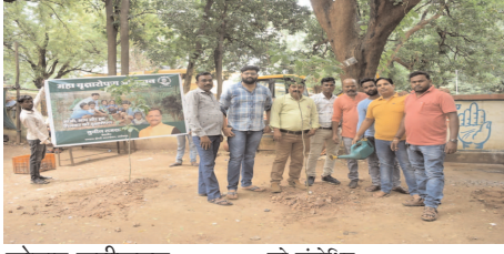
जोहार छत्तीसगढ़- रायगढ़।

अंचल में पर्यावरण संरक्षण के दिशा में कार्य करने वाली संस्था रामदास द्रौपदी फाउंडेशन द्वारा गत दिनों रामपुर क्षेत्र में नूतन विकासित कॉलोनी गोकुलधाम व रामपुर पहाड़ी के निचले क्षेत्र तथा डिग्री कॉलेज के पास पौधरोपण किया गया। वहीं नगर के बैकुंठपुर व रामलीला मैदान के आसपास पौधा वितरण किया गया।