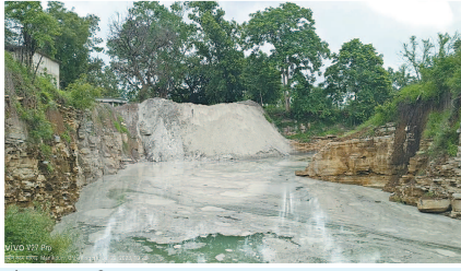
जोहार छत्तीसगढ़- सारंगढ़।

सारंगढ़, बिलाईगढ़ जिले से लगे ग्राम पंचायत खर्री बड़े में इन दिनों अवैध रूप से फ्लाई ऐश की डंपिंग की जा रही है। वही मिली जानकारी के अनुसार तिरुपति रोड केरियर द्वारा रोड से लगे हुए और नाला से 10 कदम की दूरी पर स्थित खदान में अवैध रूप से फ्लाई ऐश पाटने का काम किया जा रहा है। ना तो इनको शासन-प्रशासन की डर है और ना ही कोई अधिकारी का खौफ, बेधड़क होकर बिना नियम कायदे के ही अवैध रूप से फ्लाई ऐश की डंपिंग की जा रही है। ट्रांसपोर्ट अपनी जेब भरने के लिए अवैध रूप से फ्लाई ऐश पाट रहे हैं और कई लोगों की जिंदगियों के साथ खिलवाड़ किया जा रहा है। वही जिले बनने के बाद अधिकारियों की आवागमन भी तेजी है लेकिन इनको उच्च अधिकारियों को डर भी नहीं दिख रहा आखिर ऐसे क्यों हो रहा है। यहां लेकिन शासन-प्रशासन है कि इस ओर कभी मुह लेने की जरूरत ही नहीं समझते क्या की इतने दिनों तक इस मुख्य मार्ग से होकर गुजर रहा है। लेकिन किसी भी अधिकारी को नजर तक नहीं आया। बड़े-बड़े ठेकेदार और ट्रांसपोर्ट तो कई अधिकारियों को अपने जेब में रखकर काम