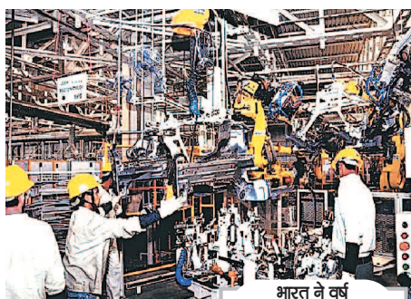
भारत ने वर्ष

कुछ दावे सही हैं। बुलेटिन में आर्थिक गतिविधियों में क्रमिक आधुनिकीकरण, ऊंची बेरोजगारी दर, मनरेगा के तहत किए जाने वाले काम की थोड़ी बढ़ी मांग, मैन्यूफैक्चरिंग उत्पादों के निर्यात में कमी, राजस्व व्यय में कमी, कुल कर संग्रह में कमी, सीपीआई यानी उपभोक्ता मूल्य सूचकांक (और खाद्य मुद्रास्फोति) में वृद्धि, घरेलू और कारपोरेट बांड्स की प्राप्ति में मुश्किलें और मुद्रास्फोति के विरुद्ध न खत्म होने वाली मुहिम को रेखांकित किया गया है। सकारात्मक और नकारात्मक चीजें हमेशा ही होती हैं। अर्थव्यवस्था की मिला-जुली तस्वीर के बावजूद भारत ने वर्ष 2004 से 2009 तक पांच वर्षों के बीच 8.5 फीसदी की, और 2004 से 2014-यानी दस साल तक 7.5 प्रतिशत की औसत वृद्धि दर हासिल की थी। इसके अमेरिका और यूरोप ने वैश्विक वित्तीय संकट