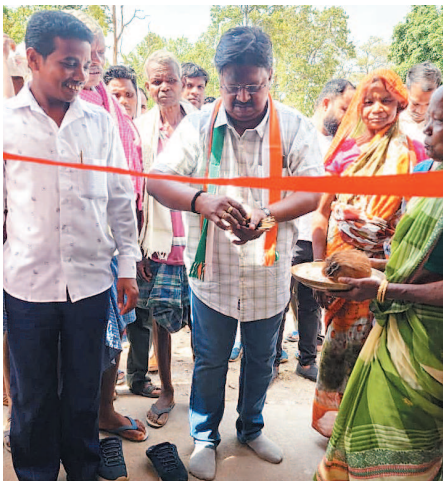
के मांगलिक कार्य हर्ष और उल्लास का कार्य मेला सहित सभी

जुड़वाइन में नवनिर्मित देवगुड़ी, हटंकलता और धारन में सामुदायिक भवन का लोकार्पण किया। इसके साथ विधायक मिंज ने ग्रामीणों से भेंट मुलाकात कर उनकी मांगों और समस्याओं को गंभीरतापूर्वक सुना और मांगों को पूर्ण करने के लिए आश्वासन भी दिए। विधायक एवं संसदीय सचिव यू.डी. मिंज ने कहा छत्तीसगढ़ सरकार लगातार आदिवासी क्षेत्रों में विभिन्न योजनाएं संचालित कर रही है। जिसका प्रत्यक्ष फायदा लोगों को मिल रहा है। जिसमें देवगुड़ी निर्माण का भी बहुत महत्वपूर्ण योगदान है। आदिवासियों के देवी देवता, पेन, पुरखा एवं संस्कृति और सभ्यता को संरक्षित करने देवगुड़ी निर्माण कराया जा रहा है। आदिवासियों में देवगुड़ी का विशेष महत्व है और सभी प्रकार