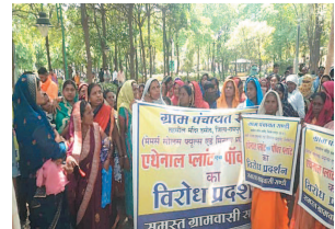
कलेक्टर के नाम ज्ञापन सौंपने वाले ग्रामीणों का

रायपुर। राजधानी रायपुर के समीप आरंग विधानसभा क्षेत्र में एथेनॉल प्लांट लगाए जाने के विरोध में ग्रामीणों ने सोमवार को रायपुर कलेक्टर ऑफिस के सामने जोरदार प्रदर्शन किया। ग्रामीणों का कहना है कि एथेनॉल प्लांट के निर्माण से इलाके में प्रदूषण बढ़ जाएगा। आरंग जनपद पंचायत के ग्राम संडी से लगभग 400 ग्रामीण तीन से चार बसों के जरिए राजधानी पहुंचे थे. ग्राम पंचायत द्वारा फर्जी ग्राम सभा कर NOC देने का आरोप लगाया.