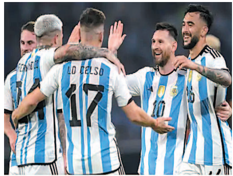
अर्जेंटीना 7-0 क्युरासाओ

फुटबॉल में इस समय इंटरनेशनल ब्रेक चल रहा है। इसी बीच सभी प्लेयर्स क्लब छोड़ अपनी नेशनल टीम के लिए मुकाबले खेल रहे हैं। इसी बीच मंगलवार देर रात अर्जेंटीना और क्युरासाओ के बीच अर्जेंटीना में फुटबॉल का फ्रेंडली मैच खेला गया। इसमें अर्जेंटीना के स्टार फुटबॉलर लियोनल मेसी ने 3 गोल स्कोर किए। वहीं, अर्जेंटीना ने क्युरासाओ को 7-0 से हराया। मेसी के अलावा एंजेल डी मारिया, निकोलस गोंजालेस, एंजो फर्नांडेज और गोंजालो मॉन्टियल ने गोल स्कोर किए। हैट्रिक के साथ ही मेसी के इंटरनेशनल फुटबॉल में 100 गोल भी पूरे हुए। अब उनके इंटरनेशनल फुटबॉल में 102 गोल