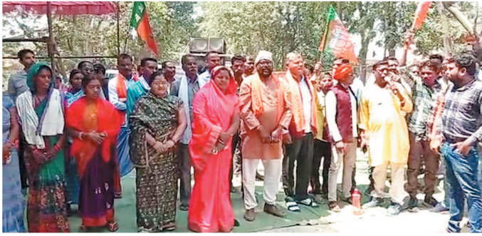
जोहार छत्तीसगढ़- धरमजयगढ़।