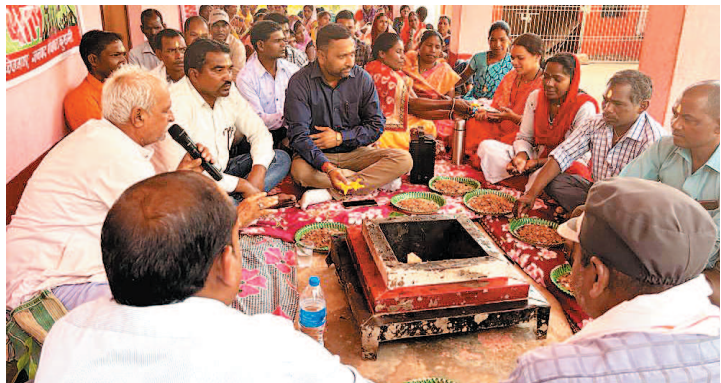
जोहार छत्तीसगढ़- कुसमी।

काम बंद कलम बंद हड़ताल का आज 14 वां दिन भी निरंतर हड़ताल जारी