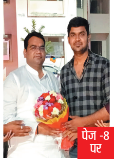
पेज -8 पर

वर्ष: -15 अंक: 139 डाक पंजीयन 030/रायगढ़/2015-2017 मूल्य: 3 ₹ पृष्ठ: 8