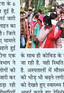
के साथ ही कोविड के मरीजों की संख्या बढ़ती जा रही है। यही स्थिति मौसमी मरीजों की भी है। अस्पतालों में मौसमी बीमारियों के मरीजों की भीड़ भी बढ़ने लगी है। इस तरह की स्थिति को देखते हुए स्वास्थ्य विभाग ने अस्पतालों को अलर्ट करते हुए ट्रेसिंग और ट्रेसिंग बढ़ाने के

बिलासपुर। छत्तीसगढ़ की बिलासपुर में पिछले एक हफ्ते में कोरोना के 6 नए मरीज मिले हैं और एक की मौत हुई है। स्वास्थ्य विभाग ने भी इसके लिए अलर्ट जारी कर दिया है। लोगों को कोरोना गाइड लाइन का पालन करने की अपील की जा रही है। जिले में पिछले कुछ महीनों से कोरोना के नए मामले नहीं आ रहे थे। लेकिन अब 3 दिन पहले हुई एक महिला की मौत के साथ ही कोरोना एक बार फिर से लौट गया है। स्वास्थ्य विभाग ने मृतक महिला की घर के आस-पास लोगों की कोरोना जांच करने के साथ ही अलर्ट जारी कर दिया है। कोरोना गाइड लाइन की उड़ा रही ध्वजियां बदलते मौसम और मौसमी बीमारियों