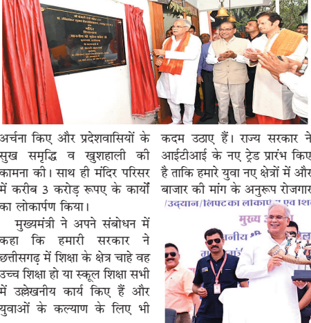
अर्चना किए और प्रदेशवासियों के सुख समृद्धि व खुशहाली की कामना की। साथ ही मंदिर परिसर में करीब 3 करोड़ रुपए के कार्यों का लोकार्पण किया। मुख्यमंत्री ने अपने संबोधन में कहा कि हमारी सरकार ने छत्तीसगढ़ में शिक्षा के क्षेत्र चाहे वह उच्च शिक्षा हो या स्कूल शिक्षा सभी में उल्लेखनीय कार्य किए हैं और युवाओं के कल्याण के लिए भी

रायपुर। मुख्यमंत्री भूपेश बघेल ने पंडित रविशंकर शुक्ल विश्वविद्यालय में लगभग 17 करोड़ रुपए के विभिन्न कार्यों का लोकार्पण और शिलान्यास किया। इसमें 10 करोड़ 03 लाख रुपए के लोकार्पण और 6 करोड़ 58 लाख रुपए के शिलान्यास कार्य शामिल हैं।