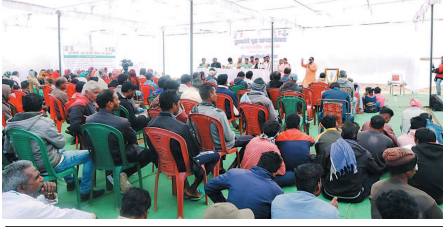
विभिन्न जनप्रतिनिधियों, कलेक्टर ने उपस्थित ग्रामीणों को योजना का लाभ लेने हेतु किया प्रोत्साहित