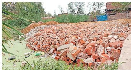
जोहार छत्तीसगढ़- रायगढ़।

अंचल का एक मशहूर गोटिया निस्तारित तालाब को निजी भूमि होने का कर रहा दावा