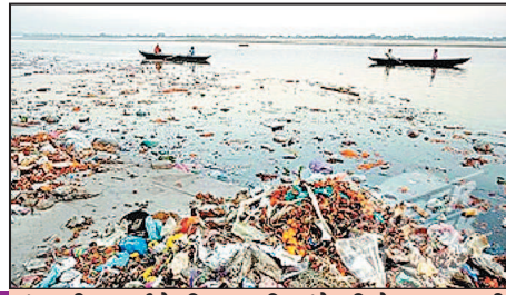
गंगा की सफाई के लिए नमामि गंगे परियोजना शुरू की गई। मगर वर्ष 2019 तक गंगा को पूरी तरह निर्मल बनाने के आश्वासन के बावजूद गंगा में स्वतंत्रताक जीवाणुओं की संख्या बढ़ती ही जा रही है।

गंगा में इतना ज्यादा प्रदूषण है कि यदि इसको फिल्टर भी किया जाए, तो यह स्वच्छ नहीं हो सकती है। वैसे बिहार में गंगा की यह स्थिति बक्सर से लेकर कहलगांव तक है। उत्तर प्रदेश में भी मेरठ, कानपुर, प्रयागराज, वाराणसी में जल शोधन के लिए जो 35 एसटीपी बनाए गए हैं, उनमें से 27 को क्षमता मानक के अनुसार नहीं है, यानी इन शहरों की जनता गंदगी गंगा में जा रही है, वह पूरी तरह साफ नहीं हो पा रही है। यहां गंगा के किनारे के शहरों से लगभग 230 गंदे नाले बह रहे हैं, जो प्रतिदिन 2,450 एमएलडी गंदी पानी गंगा में उड़ेल रहे हैं। यहां सभी 35 एसटीपी प्लांट काम करने लगे, तो उनसे 1,493 एमएलडी गंदे पानी का शोधन होना चाहिए, लेकिन इनमें से केवल आठ-नौ एसटीपी भी पूरी