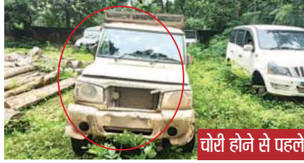
चोरी होने से पहले

पहले की तरह या तो इस तरह की अधिकांश मामलों की फाइलें धूल फांकती रह जाती हैं या दिखावे के रूप में साधारण सी कार्रवाई कर दी जाती है। मंगलवार को रायगढ़ जिले के धरमजयगढ़ वन मंडल में दो बड़े मामले सामने आए। पहली घटना धरमजयगढ़ वन मंडल के बाकारूमा रेंज की है जहां