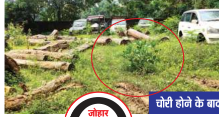
चोरी होने के बाद

जमाबीरा के जंगल में एक हाथी का पुराना शव बरामद हुआ। वहीं दूसरी सनसनीखेज घटना छाल वन परिक्षेत्र में सामने आई है जहां के कार्यालय परिसर में रखी एक जब्त वाहन को अज्ञात चोर उड़ा ले गए। इस गंभीर मामले में अधिकारी की मनमानी व लापरवाही की सीमा पार करने का खुलासा उस वक्त हुआ जब विभाग के एक वरिष्ठ अधिकारी ने बताया कि इस मामले में संबंधित रेंजर द्वारा सिर्फ मौखिक जानकारी दी गई है, लिखित में इस घटना की कोई सूचना नहीं दी गई है। हालांकि उन्होंने संबंधित अधिकारी के हवाले से यह भी बताया कि थाने में सूचना दी गई