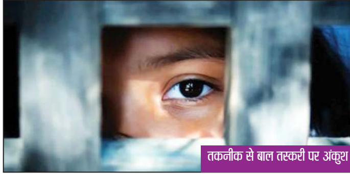
तकनीक से बाल तस्करी पर अंकुश

आरपीएफ ने अपराधियों को पकड़ने और पीड़ित बच्चों को मदद के लिए चेहरे की पहचान, बायोमेट्रिक रिकॉर्ड और एक ऑनलाइन डाटाबेस के साथ सुरक्षा कैमरों का उपयोग करने की योजना बनाई है। एक रेल अधिकारी के मुताबिक, पहले ही मार्च, 2022 तक रेलवे 840