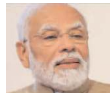
पीएम मोदी ने साइंस कॉन्वलेव का किरा उद्घाटन; कहा- देश की इंडेक्स रैंकिंग में भी हो रहा सुधार

नई दिल्ली (एजेंसी)। प्रधानमंत्री नरेन्द्र मोदी ने अहमदाबाद में शनिवार को सेंटर-स्टेट साइंस कॉन्वलेव का वर्चुअली उद्घाटन किया। पीएम मोदी ने कहा कि जब ज्ञान-विज्ञान से हमारा परिचय होता है।