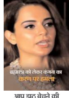
आप झूठ बचने की कोशिश करते हैं; वेईमानी कर सकते हैं, पर अच्छी फिल्म नहीं बना सकते

पर लुभाया गया। इससे लोग इस ऐप पर आकर्षित हुए। फिर लोगों ने ज्यादा कमीशन पाने के लिए बड़ी मात्रा में निवेश करना शुरू किया और फिर ऐप संचालकों ने उगी का खेल शुरू किया। कथित धोखाधड़ी के तौर-तरीकों का विवरण देते हुए, ईडी ने कहा, फिर लोगों से काफी ज्यादा रकम इकट्ठा करने के बाद, अचानक उक्त ऐप में अपग्रेडेशन के नाम पर निकासी बंद कर दी गई। इसके बाद लोगों की प्रोफाइल जानकारी सहित कई डेटा ऐप सर्वर से हटा दिया गया। तब जाकर लोगों को मालूम हुआ कि उनके साथ धोखाधड़ी हुई है।