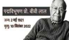
पद्मविभूषण प्रो. बीबी लाल

सबसे पहले दिया था अयोध्या में राम मंदिर का पुरातात्विक प्रमाण, पीएम मोदी ने जताया शोक