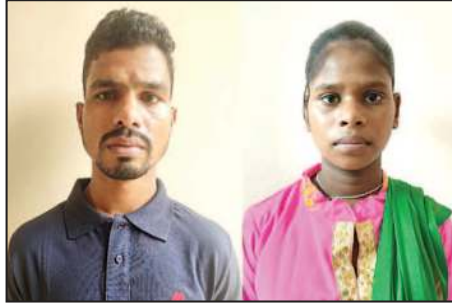
प्रभावित होकर आत्मसमर्पण किया। छत्तीसगढ़ शासन की