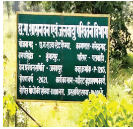
परिक्षेत्र कुंवारपुर के पतवाही बीट में कुत्तों से भटककर एक चीतल शिकार की

कोरिया जिला के वन मंडल मनेंद्रगढ़ अंतर्गत आने वाले वन परिक्षेत्र कुंवारपुर में आवारा कुत्तों के झुंड ने चीतल पर हमला कर दिया। कुत्तों के काटने से मौके पर ही चीतल की मौत हो गई वहीं हमले के दौरान कुत्तों के झुंड से टकराकर एक युवक भी गंभीर रूप से घायल हो गया। अस्पताल ले जाने पर डॉक्टरों ने उसे मृत घोषित कर दिया। आपको बता दें की मंगलवार को सुबह कोरिया जिले के वनांचल क्षेत्र भरतपुर तहसील अंतर्गत वन