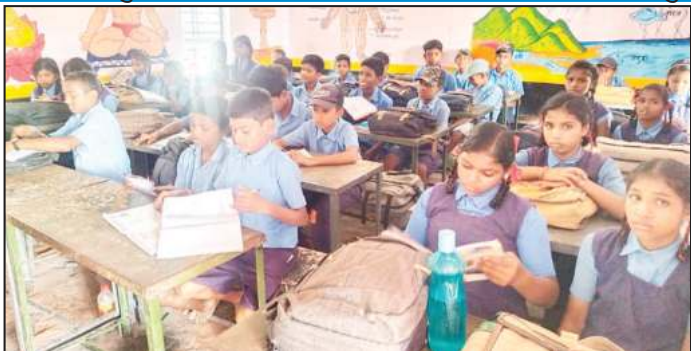
2006 से 2022 तक स्कूल का संचालन हो रहा मगर शिक्षक की कमी आज भी

बेमेतरा जिला के चंदनु थाना से महज ही दूरी पर लगा हुआ शासकीय पूर्व माध्यमिक शाला झिरिया जो सामान्य आबादी वाले क्षेत्र में आता है जहां पर प्राइमरी और मिडिल स्कूल का संचालन एक ही जगह में होता है जिसमें प्राइमरी स्कूल पर लगभग 111 बच्चे और मिडिल स्कूल में वर्तमान स्थिति में 141 बच्चे हैं और पिछले सत्र में लगभग 165 बच्चे और हो सकता है कि पिछले और सत्र में ज्यादा रहे हो और 2006 से मिडिल स्कूल प्रारंभ होने से लेकर आज दिनांक तक अभी भी यहां शिक्षकों की जो कमी है उसे पूरी नहीं की गई और सभी बच्चे अपनी पढ़ाई जारी रखे हुए हैं मगर आज भी किसी और दूसरे शिक्षक की आने की ताकत गणित और अंग्रेजी की जो पढ़ाई कम होती है या पूर्ण रूप से नहीं हो पाती है वह पूर्ण हो जाए इस