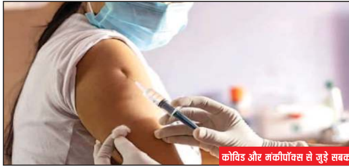
कोविड और मंकीपॉक्स से जुड़े सबक

इनमें दिल्ली के चार मामले और केरल में मंकीपॉक्स से हुई एक मौत शामिल है। अमेरिका और यूरोप के कुछ हिस्सों में जो हो रहा है, उसकी तुलना में यह संख्या बहुत कम है। लेकिन आत्मसंतुष्टि के लिए कोई जगह नहीं होनी चाहिए। कोरोना वायरस की महामारी अभी खत्म नहीं हुई है। कुछ अन्य देशों की तरह भारत भी सास-कोविड-2 के नए वैरिएंट्स और उसके विस्तार से संघर्ष कर रहा है। लाखों भारतीय कुछ अन्य बीमारियों से भी ग्रस्त हैं, लिहाजा कोविड से उनके लिए जोखिम अधिक है। दुनिया भर के वैज्ञानिक इस बात पर चर्चा कर रहे हैं कि एक नई महामारी कैसे, कब और कहाँ हो सकती है और किन उपायों से इसे रोका जा सकता है। तैयारी अत्यंत महत्वपूर्ण है। हालांकि भारत में तैयारियों को लेकर होने वाली चर्चा में अक्सर एक जरूरी तत्व,