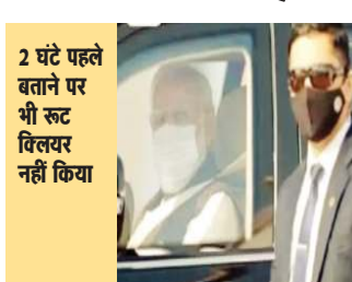
2 घंटे पहले बताने पर भी रूट क्लियर नहीं किया

चंडीगढ़। पंजाब में 5 जनवरी को पीएम नरेंद्र मोदी की सुरक्षा चूक में फिरोजपुर के स्क्व हरमनदीप हंस ने सही ढंग से कदम नहीं उठाए। उन्होंने पीएम की सुरक्षा में तैनात केंद्र के अफसरों को सहयोग नहीं किया।