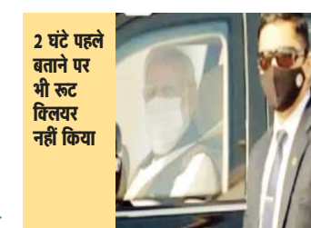
2 घंटे पहले बताने पर भी रूट क्लियर नहीं किया

चंडीगढ़। पंजाब में 5 जनवरी को पीएम नरेंद्र मोदी की सुरक्षा चूक में फिरोजपुर के स्क्व हरमनदीप हंस ने सही ढंग से कदम नहीं उठाए। उन्होंने पीएम की सुरक्षा में तैनात केंद्र के अफसरों को सहयोग नहीं किया।