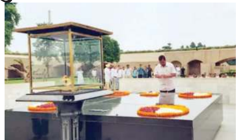
आप के मुख्य प्रवक्ता सोरभ भारद्वाज ने कहा कि दिल्ली सरकार को कोई खतरा नहीं है। सरकार स्थिर है और जो विधायक नहीं आए हैं, वो अपने-अपने काम से बाहर गए हैं। भाजपा ने हमारे 12 विधायकों को पार्टी छोड़ने के लिए ऑफर दिया है। केंद्रीय विदेश राज्य मंत्री मीनाक्षी लेखी ने इस मामले में आम आदमी पार्टी पर पलटवार किया। उन्होंने कहा, हमें आपकी सरकार तोड़ने की जरूरत नहीं है। केजरीवाल बताएं

मीटिंग के बाद केजरीवाल राजघाट पहुंचे और राष्ट्रपिता महात्मा गांधी को श्रद्धांजलि दी। उन्होंने कहा- भाजपा हमारे 40 विधायकों को खरीदना चाह रही है। सभी विधायकों को 20-20 करोड़ का ऑफर दिया जा रहा है। भाजपा 800 करोड़ रुपए खर्च कर दिल्ली सरकार गिराना चाहती है। 70 सीटों वाली दिल्ली विधानसभा में कके पास 62 और भाजपा के पास 8 सीटें हैं।