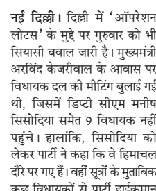
नई दिल्ली। दिल्ली में 'ऑपरेशन लोटस' के मुद्दे पर गुरुवार को भी सियासी बवाल जारी है। मुख्यमंत्री अरविंद केजरीवाल के आवास पर विधायक दल की मीटिंग बुलाई गई थी, जिसमें डिप्टी सीएम मनीष सिंसोदिया समेत 9 विधायक नहीं पहुंचे। हालांकि, सिंसोदिया को लेकर पार्टी में कहा कि वे हिमाचल दौर पर गए हैं। वहीं सूत्रों के मुताबिक कुछ विधायकों से पार्टी हार्दिकमान का संपर्क भी नहीं हो पा रहा है।

मीटिंग के बाद केजरीवाल राजघाट पहुंचे और राष्ट्रपिता महात्मा गांधी को श्रद्धांजलि दी। उन्होंने कहा- भाजपा हमारे 40 विधायकों को खरीदना चाह रही है। सभी विधायकों को 20-20 करोड़ का ऑफर दिया जा रहा है। भाजपा 800 करोड़ रुपए खर्च कर दिल्ली सरकार गिराना चाहती है। 70 सीटों वाली दिल्ली विधानसभा में कके पास 62 और भाजपा के पास 8 सीटें हैं।