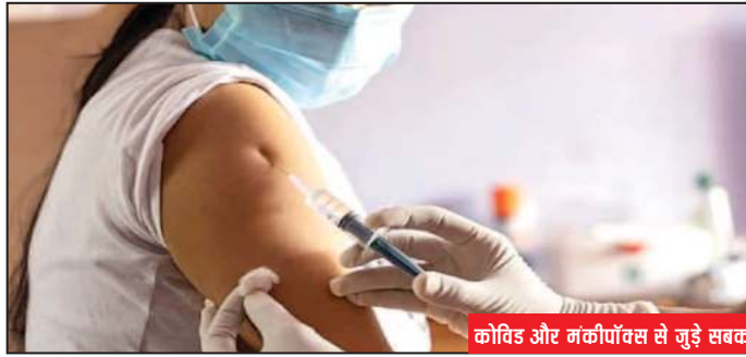
कोविड और मंकीपॉक्स से जुड़े सबक

इनमें दिल्ली के चार मामले और केरल में मंकीपॉक्स से हुई एक मौत शामिल है। अमेरिका और यूरोप के कुछ हिस्सों में जो हो रहा है, उसकी तुलना में यह संख्या बहुत कम है। लेकिन आत्मसंतुष्टि के लिए कोई जगह नहीं होनी चाहिए। कोरोना वायरस की महामारी अभी खत्म नहीं हुई है। कुछ अन्य देशों की तरह भारत भी सास-कोविड-2 के नए वैरिएंट्स और उसके विस्तार से संघर्ष कर रहा है। लाखों भारतीय कुछ अन्य बीमारियों से भी ग्रस्त हैं, लिहाजा कोविड से उनके लिए जोखिम अधिक है। दुनिया भर के वैज्ञानिक इस बात पर चर्चा कर रहे हैं कि एक नई महामारी कैसे, कब और कहाँ हो सकती है और किन उपायों से इसे रोका जा सकता है। तैयारी अत्यंत महत्वपूर्ण है। हालांकि भारत में तैयारियों को लेकर होने वाली चर्चा में अक्सर एक जरूरी तत्व,