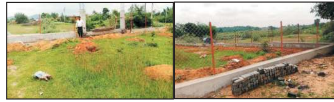
सांस्कृतिक महत्व वाले जीवोपयोगी वृक्षों का किया जाएगा रोपण

जहां आगामी कृष्ण जन्माष्टमी के दिन पूरे राज्य में कृष्ण कुंज के लिए चिन्हित स्थल पर वृक्षारोपण किया जाएगा। गौरतलब है कि मुख्यमंत्री द्वारा अपनी सांस्कृतिक विरासत एवं वृक्षारोपण को लोगों से जोड़ने व विशिष्ट पहचान देने के लिये इसका नाम कृष्ण कुंज रखा गया है। हमारे देश में बरगद, पीपल, नीम, कदंब तथा अन्य वृक्षों की पूजा करने की अत्यंत प्राचीन परंपरा है।