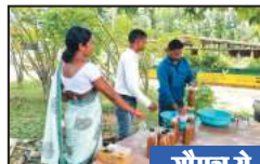
गौमूत्र से जीवामृत और जैविक कीटनाशन बनाया जा रहा है

हरेली त्यौहार के अवसर पर जशपुर विकासखंड के बालाछापर और पथलगांव विकासखण्ड के बहनाटंगर गौठान में छत्तीसगढ़ शासन की महत्वाकांक्षी योजना गौमूत्र खरीदी का शुभारंभ किया गया था। इसी कड़ी में गौठानों के माध्यम से गौमूत्र की खरीदी निरंतर की जा रही है। पशुपालन विभाग से प्राप्त जानकारी के अनुसार बालाछापर गौठान में अब तक समूह द्वारा 14 लीटर गौमूत्र की खरीदी की गई है और 7 लीटर गौमूत्र उत्पादन तैयार किया गया है। इसी प्रकार पथलगांव विकासखण्ड के बहनाटंगर में 10 लीटर गौमूत्र की खरीदी की गई है। उल्लेखनीय है कि महिलाओं को गांव में ही आर्थिक मजबूती देने के लिए गौठान को मिनी उद्योग के रूप में विकसित किया गया है। पशुपालन विभाग के पशु चिकित्सकों द्वारा समूह की महिलाओं को गौमूत्र से जैविक कीटनाशक बनाए जाने की विधि के संबंध में जानकारी दी जा रही है। विभाग द्वारा बताया जा रहा है कि 10 लीटर गौमूत्र में 2 से 3 किलोग्राम नीम पत्ती, 2 किलोग्राम सीताफल की पत्तियां, 2 किलोग्राम पीपत्ता की पत्तियां, 2 किलोग्राम अमरूद की पत्तियां, 2 किलोग्राम करंज की पत्तियां को उबालकर उसे छानने के उपरांत बोटल में पैकिंग किया जाता है। इसी प्रकार उन्होंने बताया कि जीवामृत बनाने हेतु 10 लीटर गौमूत्र में 200 लीटर पानी तथा 10 किलो गोबर 1 किलो गुड, 1 किलो बेसन, 250 ग्राम मिट्टी मिलाकर 48 घंटे तक छाया में रखने के अंतराल में 4 से 5 बार डंडे से चलाने के उपरांत जीवामृत तैयार कर लिया जाता है।