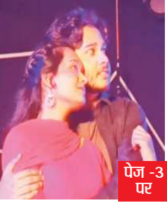
पेज -3 पर

वर्ष: -14 अंक: 264 डाक पंजीयन 030/रायगढ़/2015-2017 मूल्य: 3 ₹ पृष्ठ : 8 (4+4)