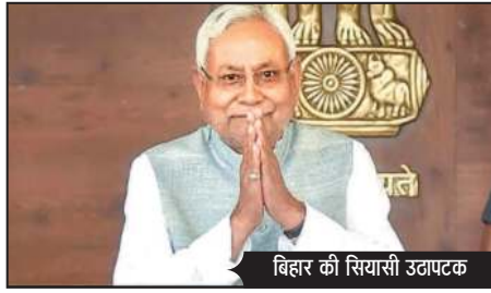
बिहार की सियासी उदात्क

निगाहें टिका रखी हों लेकिन बिहार से दिल्ली तक आगे नीतीश के लिए सबके हैं या सब के बने रहने की राह आसान नहीं है। जाहिर है, 2024 के लोकसभा चुनाव हों या 2025 के बिहार विधानसभा चुनाव, इन दोनों से पहले बिहार में शह-मात के नये-नये सियासी दांव नजर आएंगे। नीतीश के सामने अब बिहार से लेकर दिल्ली तक सबके बने रहने की चुनौती है तो भाजपा के सामने सबका साथ, सबका विकास के मंत्र का टोटा है। बिहार में बुधवार को नीतीश की फिर से मुख्यमंत्री के पद पर आठवां बार ताजपोशी हो गई। नीतीश ने लालटेन की लौ तेज कर दी है। अपने लिए भी उम्मीद रोशन की है। बिहार में नए मंत्रिमंडल गठन से पहले ही स्पीकर और गृह मंत्री की कुर्सी को लेकर खींचतान की चर्चा तैर गई।