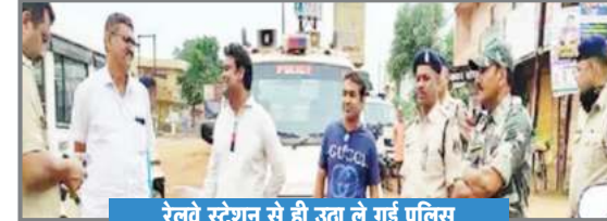
रेलवे स्टेशन से ही उठा ले गई पुलिस