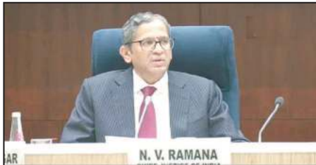
आजादी के बाद 75 सालों में न्यायपालिका के विकास को तीन हिस्सों में समझा जा सकता है। शुरुआती दौर में स्वतंत्र न्यायपालिका को आपातकाल में इंदिरा सरकार ने हस्तगत करने का प्रयास किया। उसके बाद गठबंधन सरकारों के दौर में कोलेजियम की आड में जजों की नियुक्ति पर एकाधिकार हासिल कर लिया।

सेलिब्रिटीज और बड़े आपराधिक मामलों में मीडिया ट्रेड से क्या न्यायिक व्यवस्था प्रभावित होती है? अनेक चर्चित मामलों की सुनवाई और फैसलों से इन सवाल का जवाब हां में दिया जा सकता है। इसके बाद सबसे मौजू सवाल यह है कि क्या न्यायपालिका से आम जनता की उम्मीदें धुंधली हो गई हैं? इस सवाल के जवाब के लिए नवनिर्वाचित राष्ट्रपति द्रौपदी मुर्मू के सबसे अहम बयान पर गौर करना जरूरी है, जिसमें उन्होंने विवेक वर्ग के उत्थान के लिए सबके प्रयास और सबके कर्तव्य का आवाहन किया है। आजादी के 75वें साल में देश के गणतंत्र और साविधानिक व्यवस्था का लेखा-जोखा करना जरूरी है। इससे दो बातें साफ होती हैं। पहला-रिपोर्ट कार्ड में फेल विधायक, सांसद, मंत्री, मुख्यमंत्री और प्रधानमंत्री समेत किसी भी नेता को जनता पांच साल बाद