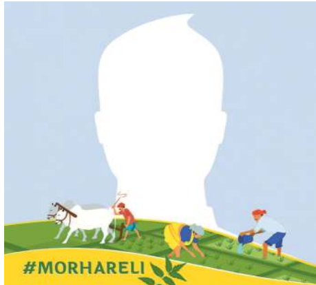
#MORHARELI किया गया है। इन दोनों चयनित गौठानों में 400 से अधिक पशुओं की संख्या है। लिहाजा इसका लाभ समूह के साथ पशुपालकों को मिलेगा। हार्दयकल्वर विभाग द्वारा गौ-मूत्र के उत्पादों के निर्माण के लिए नीम, करंज, सीताफल जैसे

राज्य में गौ-मूत्र क्रय के लिए न्यूनतम राशि 4 रूपए प्रति लीटर प्रस्तावित की गई है। क्रय गौ-मूत्र से महिला स्व-सहायता समूह की मदद से जीवामृत एवं कीट नियंत्रक उत्पाद तैयार किए जाएंगे। जिले के गौठानों में 28 जुलाई को हरेली त्यौहार मनाया जाएगा। इस मौके पर विविध कार्यक्रमों का आयोजन किया जाएगा। जिसमें गेड़ी दौड़, कुर्सी दौड़, फुगड़ी, रस्साकशी, भौंरा, नारियल फेंक आदि की प्रतियोगिताएं तथा छत्तीसगढ़ी पारंपरिक व्यंजन आदि की भी स्पर्धाएं होंगी। उप संचालक पशुपालन पाण्डेय ने बताया कि गौ-मूत्र खरीदी के लिए समूह का चयन कर गौ-मूत्र खरीदी व टेस्टिंग संबंधी सभी प्रकार की ट्रेनिंग दी गई है। जिससे समूह को गौ-मूत्र खरीदी में परेशानी न हो। पशुपालन विभाग द्वारा गौ-मूत्र टेस्ट के लिए पीएच मीटर तथा यूरिनो मीटर प्रदान