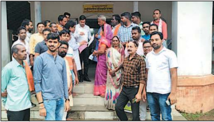
जोहार छत्तीसगढ़- धरमजयगढ़।

सहकारी समिति में तालाबंदी व विद्युत विभाग प्रांगण में धरना प्रदर्शन