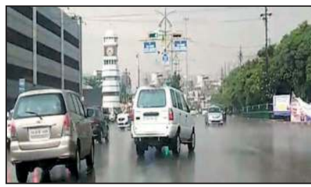
बरसात और आकाशीय बिजली गिरने का रेड अलर्ट जारी किया

रायपुर। छत्तीसगढ़ के अधिकांश हिस्सों में बरसात का सिलसिला तेज हो गया है। रविवार को बीजापुर में एक्स्ट्रीमली हेवी बरसात दर्ज हुई। वहां एक ही दिन के भीतर 22 सेंटीमीटर पानी बरसा है। यह इस सीजन को सबसे तेज बरसात है। प्रदेश के 6 जिलों में अब भी भारी से अति भारी बरसात और वज्रपात का रेड अलर्ट जारी है। मौसम विभाग के मुताबिक रविवार को पछांजुर में 11