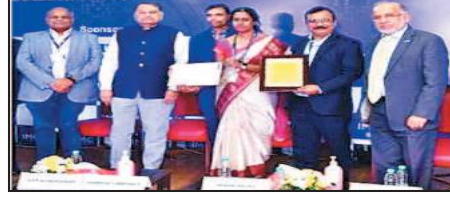
उपलब्धता और पंजीयन विभाग से पंजीयन की समस्याओं में कमी लाने के लिए यह पुरस्कार प्रदान

लिफ्ट यह पुरस्कार कार्यालय आयुक्त भू-अभिलेख और राष्ट्रीय सूचना विज्ञान केंद्र को प्रदान किया गया है। मुख्यमंत्री श्री भूपेश बघेल एवं राजस्व मंत्री श्री जयसिंह अग्रवाल ने भू-अभिलेख विभाग एवं राष्ट्रीय सूचना विज्ञान केंद्र को इस पुरस्कार के लिए बधाई एवं शुभकामनाएं दी हैं। डिजिटल हस्ताक्षरित भू-अभिलेखों, ऑनलाइन नक्शों की