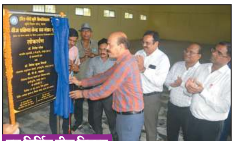
नव निर्मित बीज विक्रय केन्द्र सह भण्डारण गृह का हुआ लोकार्पण