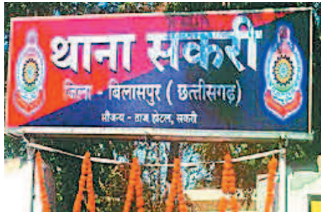
महिला एएसपी होने के वावजूद भी दुष्कर्म जैसे अपराध में गंभीर नहीं है न्यायधानी की पुलिस

इस तरह के गंभीर मामलों में पुलिस की ऐसी लापरवाही समझ से परे है। साल 2020 में सकरी थाना में पीड़िता की शिकायत पर पुलिस ने दुष्कर्म के तहत अपराध