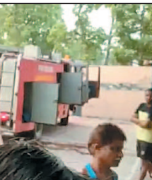
रात को यहां हादसा हो गया। कहा जा रहा है कि देर रात ही गोदाम के

अंदर आग लग गई थी। क्योंकि कमरे के अंदर आग की काफी तेज लपटें थीं। घटना के बारे में पता तब चल पाया। जब सुबह के वक लोग मॉनिंग वॉक पर निकले थे। जिसके बाद पुलिस और दमकल की गाड़ी को मौके पर बुलाया गया। सूचना मिलने के बाद करीब सुबह 6 बजे ही टीम मौके पर पहुंच गई थी। जिसके बाद करीब 2 घंटे की मशकत के बाद आग पर काबू पा लिया गया है।