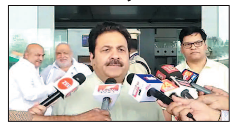
हॉर्स ट्रेडिंग में रहती है, लेकिन वे सफल नहीं होंगे।

रायपुर। अखिल भारतीय कांग्रेस कमेटी ने छत्तीसगढ़ के सीएम भूपेश बघेल और नवनिर्वाचित राज्यसभा सांसद राजीव शुक्ला को हरियाणा चुनाव के लिए ऑब्जर्वर बनाया है।