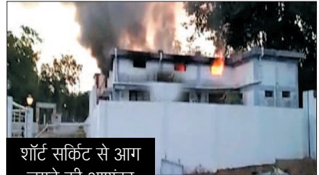
शॉर्ट सर्किट से आग लगने की आशंका

गरियाबंद। छत्तीसगढ़ के गरियाबंद में स्वास्थ्य विभाग के गोदाम में आग लग गई। आग लगने की वजह से अंदर रखा 10 लाख रुपए से ज्यादा का मेडिकल सामान जलकर राख हो गया है।