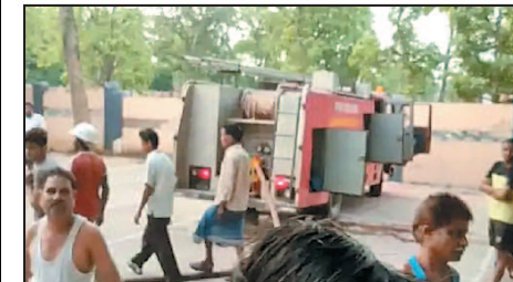
रात को यहां हादसा हो गया। कहा जा रहा है कि देर रात ही गोदाम के

अंदर आग लग गई थी। क्योंकि कमरे के अंदर आग की काफी तेज लपटें थीं। घटना के बारे में पता तब चल पाया। जब सुबह के वक लोग मॉनिंग वॉक पर निकले थे। जिसके बाद पुलिस और दमकल की गाड़ी को मौके पर बुलाया गया। सूचना मिलने के बाद करीब सुबह 6 बजे ही टीम मौके पर पहुंच गई थी। जिसके बाद करीब 2 घंटे की मशकत के बाद आग पर काबू पा लिया गया है।