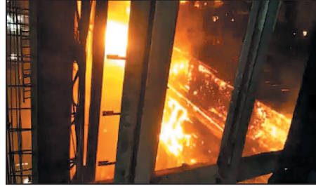
सूत्रों से मिली जानकारी के मुताबिक हॉट मेटल से भरे हुए

की चपेट में आने से 4 कर्मचारी झुलसे गए। झुलसे कर्मियों को मेन मेडिकल पोस्ट में प्राथमिक उपचार के बाद सेक्टर-9 रेफर कर दिया गया। हादसे में 2 कर्मियों की हालत गंभीर बताई जा रही है। बीएसपी में 4 दिनों में यह 3 तीसरी घटना है। कारखाने में लगातार हादसों ने संयंत्र प्रबंधन के सेफ्टी दावों पर सवाल खड़ा कर दिया है। वहीं कर्मचारी संगठनों में आक्रोश भी पनप रहा है।