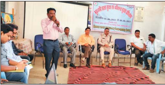
जोहार छत्तीसगढ़- धरमजयगढ़।

डाइट प्राचार्य व थाना प्रभारी कार्यक्रम में हुए शामिल, सुरक्षा को लेकर दिए सुझाव