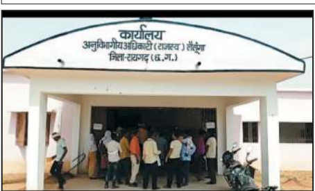
जोहार छत्तीसगढ़- लैलूंगा।

एसडीएम के आवासन के बाद धरना से उठे ग्रामीण