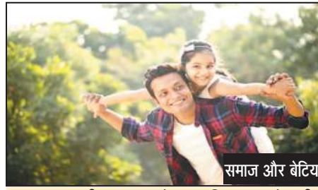
समाज और बेटियाँ

विचारणीय विषय तो यह है कि जो महिलाएँ स्वयं बेटी होती हैं, उनका बहुमत भी बेटों के पक्ष में नजर आ रहा है। इसके अनुसार, 16 प्रतिशत पुरुष और 14 प्रतिशत महिला यानी 15 प्रतिशत लोग बेटियों की तुलना में बेटी पैदा होने की अभिलाषा रखते हैं। नतीजतन