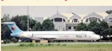
ऑनलाइन टेंडर जारी किया जाएगा।

रायपुर। ढाका से मस्कट जा रहे बांग्लादेशी एयरलाइंस का विमान रायपुर में इमरजेंसी लैंडिंग के बाद करीब 7 साल से रायपुर एयरपोर्ट पर खड़ा है। तीन एयरपोर्ट डायरेक्टर बदलने के बावजूद अभी तक यह विमान रायपुर से बांग्लादेश के लिए रवाना नहीं हुआ है। विमान की कीमत करीब 180 करोड़ रुपये है।