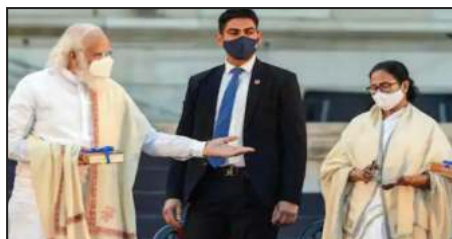
सरकार और भाजपा के नेतृत्व वाला एनडीए अपने उम्मीदवार के लिए संभावित बाधाओं को दूर करने में पूरी तरह से लगा हुआ है। राष्ट्रपति पद में अपने उम्मीदवार को फिर से लाने के लिए एनडीए के वोटों में मामूली

नई दिल्ली। मुख्य चुनाव आयुक्त गुरवार को जिस समय राष्ट्रपति चुनाव के कार्यक्रम की घोषणा कर रहे थे, उसी समय राज्यसभा में कांग्रेस के विपक्ष के नेता मल्लिकार्जुन खड़गे ने कुछ मित्र दलों के नेताओं को टेलीफोन कॉल किए। इस दौरान उन्होंने एक %आम विपक्षी उम्मीदवार% के प्रति एकता की बात रखी, जो कि राष्ट्रपति कोविंद के उत्तराधिकारी के लिए सत्तारूढ़ एनडीए के उम्मीदवार के खिलाफ खड़ा होगा। सत्ताधारी दल के खिलाफ राष्ट्रपति पद के उम्मीदवार के लिए 'अधिकतम विपक्षी एकता' सुनिश्चित करना आसान काम नहीं है। वह भी तब