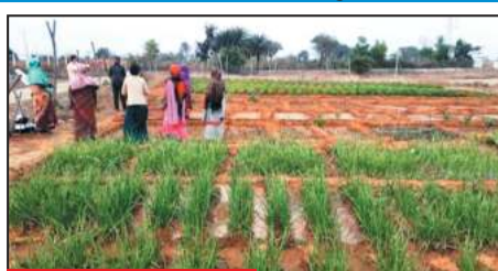
महिलाओं ने आर्थिक रूप से सशक्त बनाने हेतु छत्तीसगढ़ शासन एवं जिला प्रशासन का जताया आभार

जशपुर जिले में गौतान के माध्यम से स्व.सहायता समूह की महिलाओं को आर्थिक रूप से सशक्त बनाने विभिन्न प्रकार के आजीविका मूलक योजनाओं से जोड़ा जा रहा है। जिससे वे आत्मनिर्भर बन सकें और अपने परिवार को आर्थिक मदद प्रदान कर सकें। इसी कड़ी में कांसाबेल के मॉडल गौतान ग्राम रजौटी गौतान की चम्पा स्व.सहायता समूह की महिलाएं मल्टीप्लैटिविटी के तहत गौतान की उपलब्ध भूमि में सामुदायिक बाड़ी में सब्जी उत्पादन कार्य हेतु 0.400 हे.भूमि का चयन किया गया। जिसमें जिला प्रशासन के सहयोग से ड्रिप सिस्टम लगाया गया है। समूह की महिलाओं ने बताया कि सामुदायिक बाड़ी में सब्जी उत्पादन के लिये उद्यान विभाग एवं एनआरएलएम विभाग द्वारा उचित मार्गदर्शन किया गया।