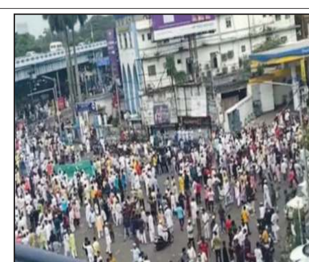
जुमे की नमाज के बाद प्रयागराज में पत्थरबाजी