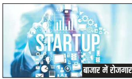
बाजार में रोजगार

पेटिएम, फ्लिपकार्ट, ओला, बिग बास्केट, बाईजू, ग्रोफर्स जैसी भारतीय स्टार्ट अप कंपनियों को बच्चा-बच्चा जानता है। उद्योग और वाणिज्य मंत्रालय के आंकड़ों के मुताबिक, इस साल मई तक देश में कुल 69,000 स्टार्ट अप कार्यरत थे। इस साल के पहले छह महीनों में 14 स्टार्ट अप यूनिफॉर्म बने-यानी जिनका वैल्यूशन एक अरब डॉलर से अधिक है। दूसरी ओर, स्टार्ट अप कंपनियां धड़बड़ अपना शटर गिरा रही हैं या बड़े पैमाने पर छंटी कर रही हैं। एक सर्वे के मुताबिक, नामी-गिरामी स्टार्ट अप कंपनियों ने इस साल 9,000 से भी अधिक कर्मचारियों को छंटी की। दरअसल इस साल स्टार्ट अप कंपनियों की विदेशी फंडिंग कम होने आधी रह गई है, जबकि उनके खर्च जस के तय रहे। स्टार्ट अप कंपनियों में कई गुना अधिक