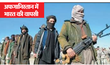
अफगानिस्तान में भारत की वापसी

अल कायदा भले ही वैसा ताकतवर नहीं रहा, जैसा वह 9/11 के समय था, लेकिन आईएस और टीटीपी (तहरीक-ए-तालिबान पाकिस्तान) ने उसकी जगह ले ली। भारत को निशाना बनाने वाले लश्कर और जैश जैसे आतंकी समूह भी मजबूत बने रहे। पिछले साल अमेरिका द्वारा वित्त पोषित अशरफ गनी की सरकार गिरने का मतलब था कि अफगानिस्तान में उथल-पुथल बरकरार रहे। वैसी स्थिति में भारत के सामने अपने राजनयिकों को वहां से बाहर निकाल लेने के अलावा और कोई विकल्प नहीं था। वैसे में उन अफगानी नागरिकों से भी भारत का रिश्ता टूट गया, शांति काल में वह जिनका मदद कर रहा था। अलकायदा काबुल में स्थिति सहज होते ही भारत ने अपनी अफगानिस्तान नीति पर पुनर्विचार करने का फैसला किया। जैसा कि विदेश मंत्रालय ने रेखांकित किया