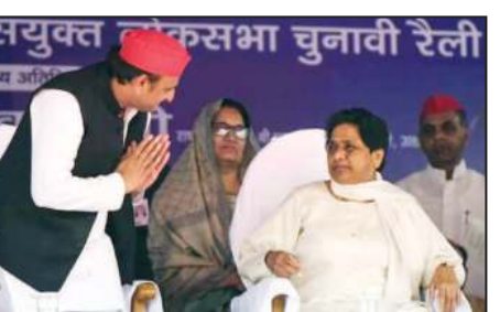
सपा प्रमुख अखिलेश यादव के लिए भविष्य की राहें कठिन कर सकता है? रामपुर लोकसभा सीट पर मायावती ने अपना प्रत्याशी नहीं उतारा था जबकि आजमगढ़ सीट पर बसपा ने गुड्डू जमाली को कैडिडेट बनाया था. आजमगढ़ में बीजेपी प्रत्याशी दिनेश लाल यादव उर्फ निरहुआ को 3,12,768 वोट मिले हैं।

नई दिल्ली। उत्तरप्रदेश के लोकसभा उपचुनाव में बीजेपी के आगे न आजम खान का गढ़ रामपुर बचा और न ही आजमगढ़ में सपा अपना वरचस्व बचा पाई. दोनों ही लोकसभा सीटें बीजेपी जीतने में कामयाब रही. रामपुर में धनश्याम सिंह लोधी और आजमगढ़ में दिनेश लाल यादव 'निरहुआ' ने जीत दर्ज की है. वहीं, आजमगढ़ में बसपा प्रत्याशी शाह आलम उर्फ गुड्डू जमाली भले ही तीसरे नंबर पर रहे, लेकिन बसपा प्रमुख मायावती का दलित-मुस्लिम फॉर्मूला यहां कारगर दिखाई दिया. मायावती ने इस सिंथासी प्रयोग को लेकर आगे भी चलने के संकेत दे दिए हैं, जो