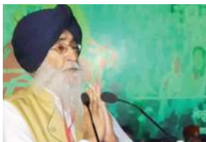
जा सकता. कांग्रेस प्रवक्ता जयवीर शेरगिल ने ट्वीट किया, संगरूर उपचुनाव के नतीजे पंजाब के सभी हिंदुधरकों के लिए खतरों की घंटी की तरह काम करेंगे. कांग्रेस के रवनीत सिंह बिंदू ने ट्वीट किया, 'लोगों द्वारा दिया गया जनदेश हमेशा सर्वोच्च होता है और इस बार यह सिमरनजीत सिंह मान के पक्ष में गया है।

चंडीगढ़। पंजाब के मुख्यमंत्री भवत सिंह मान के गृह क्षेत्र संगरूर से उपचुनाव जीतने वाले शिरोमणि अकाली दल (अमृतसर) के उम्मीदवार सिमरनजीत सिंह मान ने इसका श्रेय चरमपंथी नेता जसनेल सिंह भिंडरावाले को दिया है और कहा कि, 'वह कश्मीर में भारतीय सेना के अत्याचारों के मुद्दों को संसद में उठाएंगे।' आम आदमी पार्टी के उम्मीदवार को हराने वाले सिमरनजीत मान ने कहा कि वह बिहार और छत्तीसगढ़ में आदिवासी लोगों की नक्सली बतारक हत्या किए जाने को भी उठाएंगे। कांग्रेस ने उनके चुनाव जीतने पर चिंता व्यक्त की है। पार्टी प्रवक्ता रणदीप सिंह सुरजेवाला ने ट्वीट किया, 'आज संगरूर में लोकतंत्र हार गया' सुरजेवाला ने ट्वीट किया, 'पंजाब को हिंसा और आतंकीवाद की अंधी गली में पीछे नहीं धकेलना