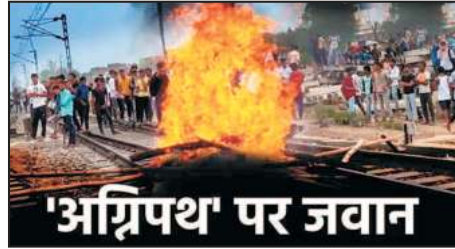
'अग्निपथ' पर जवान

अग्निपथ योजना के तहत अग्निवीर बनने वाले इन युवाओं को सेवा अवधि उपरंत लाखों रुपये मिलेंगे। इसके बावजूद भी देश का युवा आक्रोशित है? इससे पहले भी किसान