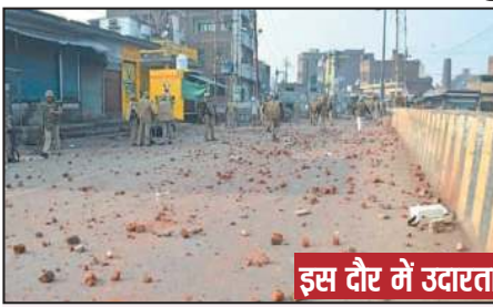
इस दौर में उदारता

मैं बांग्लादेश में रह रहे ऐसे अनेक हिंदू परिवारों को जानती हूँ, जिन्होंने अपने बच्चों के नाम के साथ टाइल नहीं लगाया है। जाहिर है, बगीर टाइल के यह पता लगाना मुश्किल है कि बच्चे हिंदू हैं या मुसलमान। इसी से पता चलता है कि बांग्लादेश में रह रहे