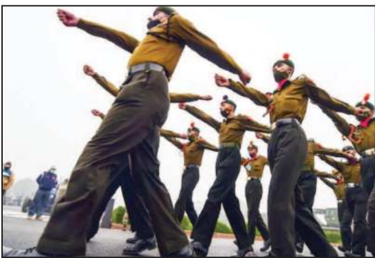
रक्षा मंत्रालय की भर्तियों में 10% आरक्षण

16-17 और 18 जून को इस योजना का इतना भयानक विरोध हुआ कि सरकार बैकफुट पर आ गई। इसके बाद सरकार ने इस योजना में एक के बाद एक कई बदलाव किए और प्रदर्शनकारी छात्रों का गुस्सा शांत करने की कोशिश की।