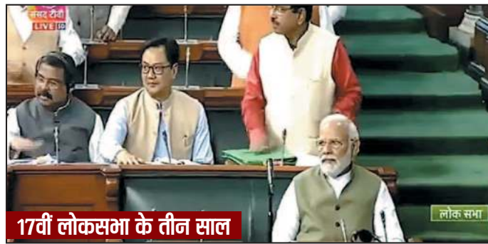
17वीं लोकसभा के तीन साल

धारा 370 हटाना मोदी सरकार के दूसरे कार्यकाल की सबसे बड़ी उपलब्धि मानी जा सकती है, क्योंकि जनसंघ से भाजपा तक के सफर में यह उनके कार्यकर्ताओं की बीच सबसे बड़ा भावनात्मक मुद्दा था। अगर हम 17वीं लोक