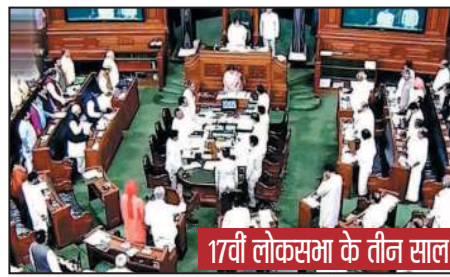
17वीं लोकसभा के तीन साल

17 जून 2019 को 17वीं लोक सभा की पहली बैठक हुई थी। इस लिहाज से देखें तो 17वीं लोक सभा के तीन साल पूरे हुए हैं और बीते तीन सालों में कोरोना जैसे वैश्विक महामारी के बावजूद हमने संसद की सुनहरी तस्वीर देखी है जो भारत में संसदीय लोकतंत्र की मजबूती को दर्शाता है। 17वीं लोक सभा के तीन साल के आकड़े इसकी तस्वीर करते हैं। 17वीं लोक सभा के आठ सत्रों में कार्य उत्पादकता 106 प्रतिशत रही है जो 14वीं, 15वीं और 16वीं लोक सभा के पहले तीन सत्रों से बहुत ज्यादा है। कानून बनाना लोकसभा की महत्वपूर्ण जिम्मेदारियों में से एक है। इसी से जनहित की बेहतर नीतियां लागू होती हैं और जनप्रतिनिधि अपनी भूमिका के साथ न्याय करते हैं। इस लिहाज से 17वीं लोकसभा के बीते तीन साल काफी महत्वपूर्ण रहे हैं। इन तीन वर्षों में लोक सभा में 139 विधेयक पेश हुए, जबकि