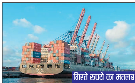
गिरते रुपये का मतलब

जिस तरह से पाम ऑयल और अन्य खाद्य तेलों के दामों में बढ़ोतरी हुई है, उसे देखते हुए मेरे दोस्त की पत्नी ने डॉलर को लेकर की गई उसकी टिप्पणी से असहमत जताई। उसने अपने पति को याद दिलाया कि हमें आज जो महंगा पेट्रोल या डीजल लेना पड़ रहा है, उसका कारण कच्चे तेल के बढ़ते दाम हैं। सचमुच हम आज ऐसी दुनिया में रह रहे हैं, जो पूरी तरह से एक-दूसरे से जुड़ी हुई है और एक-दूसरे पर निर्भर है। एक देश में यदि सूखा पड़ता है या कहीं और अत्यधिक बारिश होती है, तो इससे वैश्विक कारोबार का तरीका बदल जाता है। आइए पहले यह समझें कि भारत आयात की तुलना में मूल्य के संदर्भ में वस्तुओं और सेवाओं का निर्यात बहुत कम करता है। व्यापार की भाषा में इसका मतलब है कि अगर भारत 100 रुपये के सामान का निर्यात करता है, तो वह डेढ़ गुना या 150