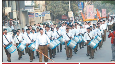
संगठन पर ही केंद्रित था।

कार्यपूर्ति ही विश्रुति ऐसा एकसंघ गीत है। 100 साल की यात्रा के प्रमुख 04 पड़ाव संघ कार्य की इस विस्तार यात्रा के चार प्रमुख पड़ाव रहे हैं। पहला पड़ाव संघ स्थापना से स्वाधीनता तक माना जाएगा। जिसमें एक चिंत से, एकाग्रता से केवल संगठन पर ही ध्यान केंद्रित था, क्योंकि हिन्दू समाज संगठित हो सकता है, कदम से कदम मिलाकर एक दिशा में एक साथ चल सकता है, एक मन से एक स्वर में भारत की, हिन्दुत्व की बात कर सकता, ऐसा विश्वास निर्माण करना आवश्यक था, इसीलिए इसी को केंद्र बिंदु बनाकर सारे कार्य चल रहे थे। स्वयंसेवक व्यक्तिगत स्तर पर उस समय चल रहे स्वाधीनता आंदोलन, समाज सुधार आदि आंदोलनों में भाग ले रहे थे, पर संघ संगठन के नाते पूरा ध्यान