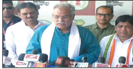
किया जाए। इसमें सांस्कृतिक-धार्मिक महत्व के पीछे लगाने की तैयारी थी। मुख्यमंत्री का कहना था, इसमें पीछ रोपण की शुरुआत

उनको राम की याद केवल वोट के लिए आती है। यहाँ राम, कृष्ण और शिव संस्कृति और परंपरा में रहे-बसे हुए हैं। उनकी पूजा भाजपा वालों ने नहीं सिखाया है। ये लोग यहाँ इसलिए बौखलाए हुए हैं क्योंकि इनकी जमीन खिसक चुकी है। मुख्यमंत्री भूपेश बघेल ने सोमवार को कलेक्टरों को निर्देश दिया था कि शहरों में एक एकड़ जमीन पर कृष्ण कुंज विकसित