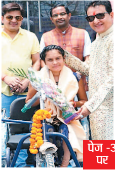
पेज -3 पर