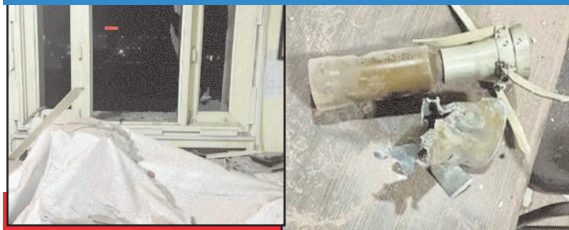
NIA की टीम पहुंची