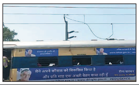
मेने अपने कोशिश को विकसित किया है और प्रति माह एक अच्छी वेतन काम रही है

खास बात यह है कि हादसे को लेकर अफसरों के पास देर तक कोई जानकारी नहीं थी। रेलवे के CPRO साकेत रंजन से बात की गई तो उन्होंने अनभिज्ञता जताते हुए पता करने को कहा। फिर थोड़ी देर बताया कि पेड़ टूटकर गिरने से OHE लाइन का तार टूटा था। इसके आगे की जानकारी फिलहाल उनके पास नहीं है।