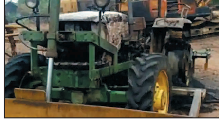
मिली जानकारी के अनुसार स्थित एटापल्ली इलाके में सड़क गढ़चिरोली के हालेवारा थाना क्षेत्र निर्माण का काम चल रहा था।

माओवादियों ने मजदूरों को सड़क निर्माण नहीं करने की चेतावनी दी है। वहीं सड़क निर्माण करने पर अंजाम भुगताने की धमकी दी है। फिलहाल सड़क निर्माण काम बंद कर दिया गया है।