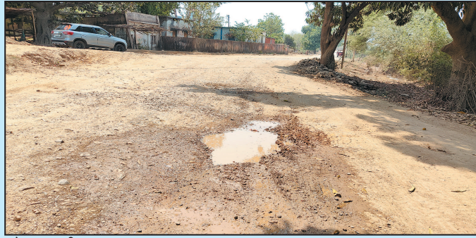
जोहार छत्तीसगढ़- धरमजयगढ़।

सीसी रोड को बना दिया परिवर्तित मार्ग, भारी वाहन चलने से नगर की सड़क हुई खराब, अधिकारी मौन