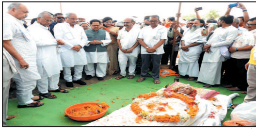
मुख्यमंत्री ने शोक संतप्त परिवारजनों से भेंट कर अपनी संवेदना प्रकट की और